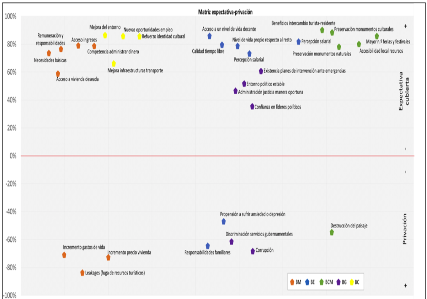
Figura 3 MEP aplicada al caso de República Dominicana

Este comportamiento ha sido denominado como el efecto "montaña rusa" en la medida en que, en un destino emergente como República Dominicana, a corto plazo los beneficios materiales parecen