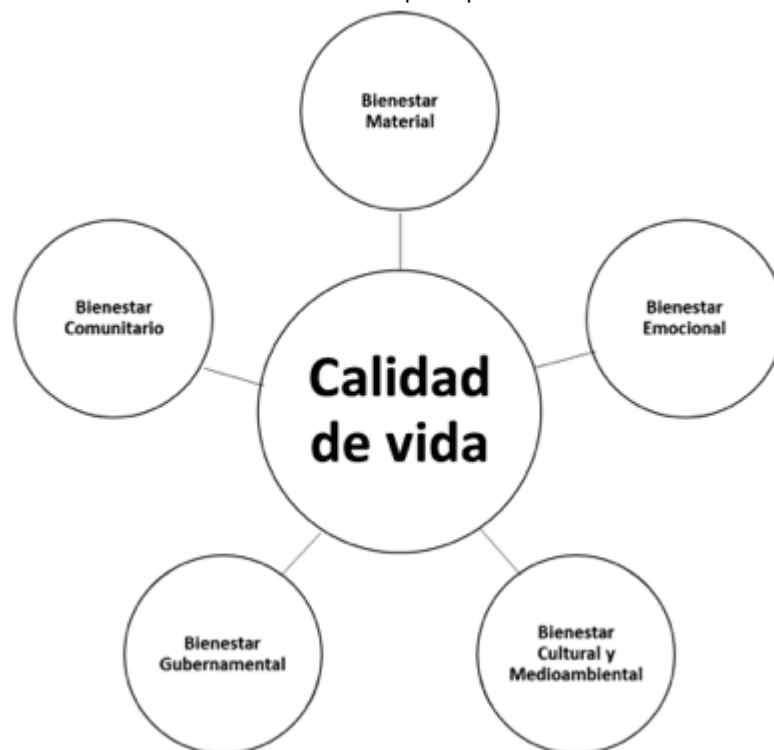
Figura 1 La calidad de vida y sus constructos principales

Los modelos de CV en la literatura se encuentran asociados a un mayor o menor número de dimensiones, en función del fenómeno que se desea analizar. En esta sección se presentan aquellos constructos que, si bien pueden recibir alguna denominación alternativa en otros trabajos, los aspectos que analizan, coinciden con lo que la literatura académica considera a la hora de abordar un análisis socio-económico como el que se presenta (Figura 1): bienestar material (BM), bienestar emocional (BE), bienestar cultural y medioambiental (BCM), bienestar gubernamental (BG) y bienestar comunitario (BC).