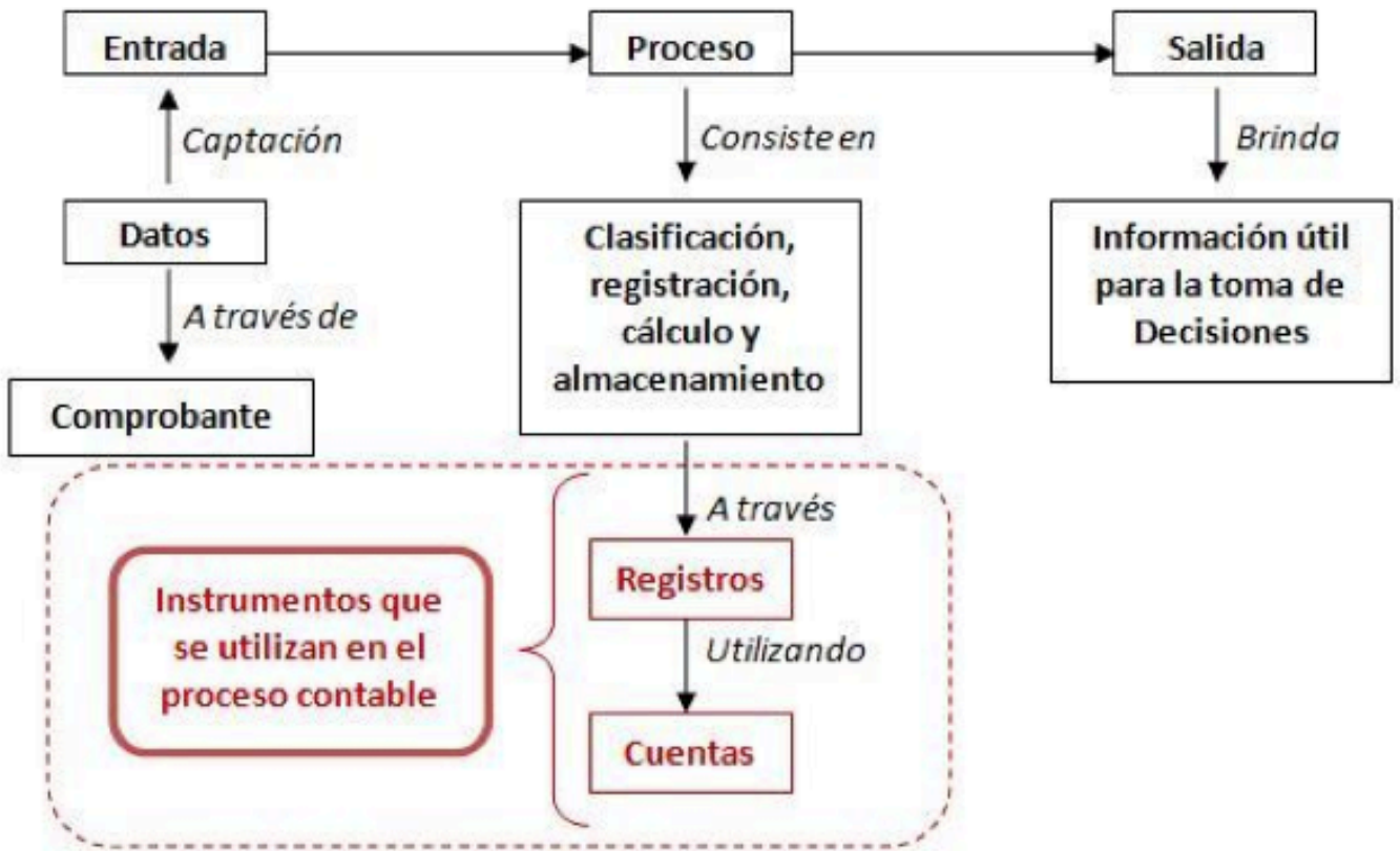
Figura 3 ¿Cómo funciona el Sistema Contable?